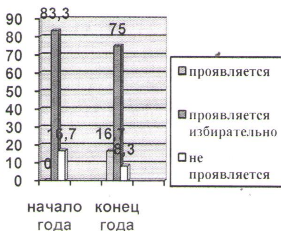
Старшая группа № 8