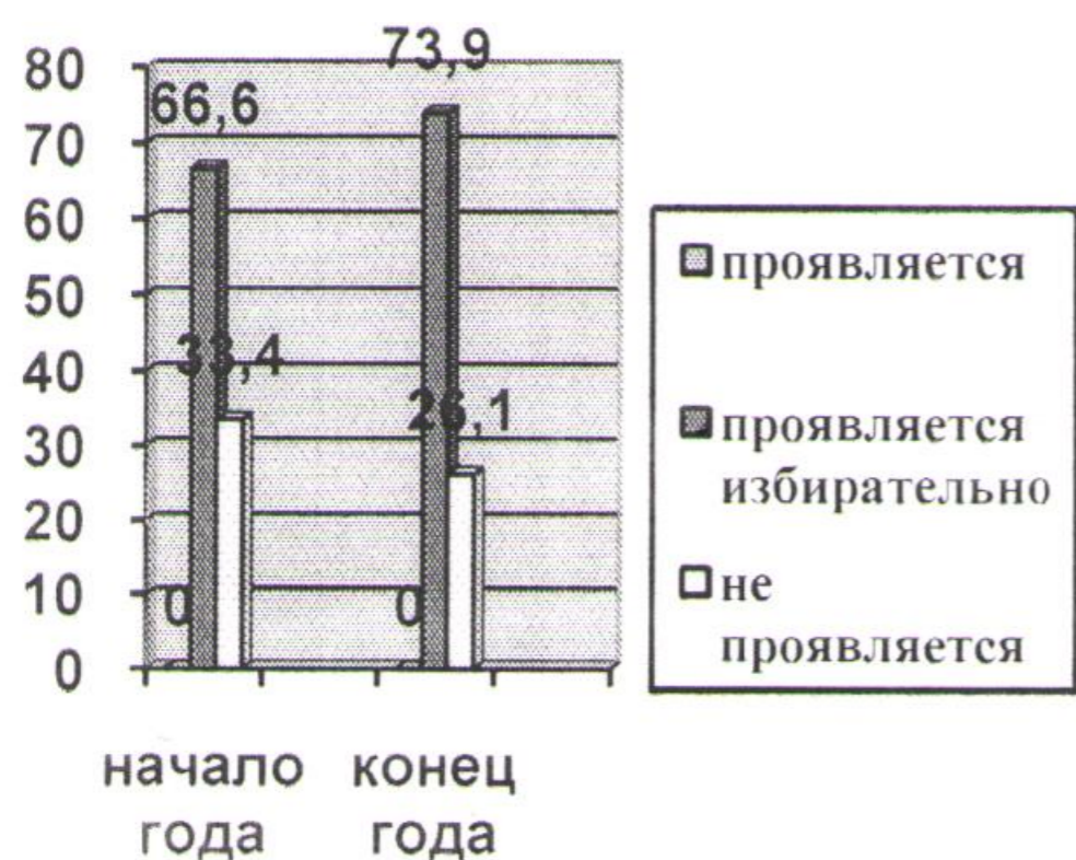
Старшая группа № 5