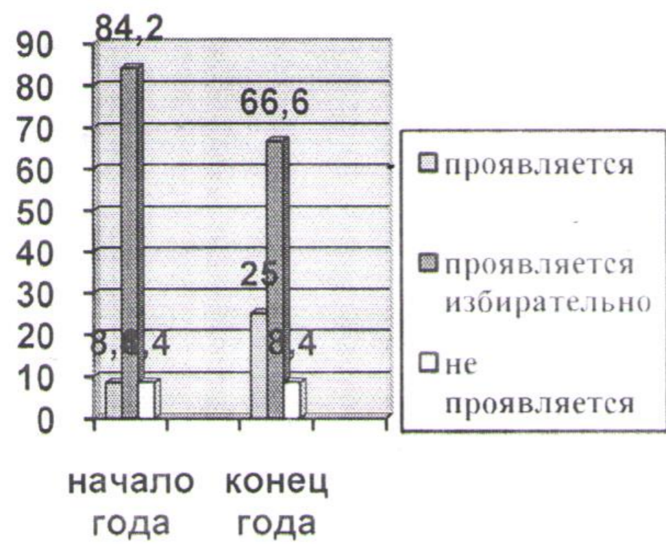
Старшая группа № 3