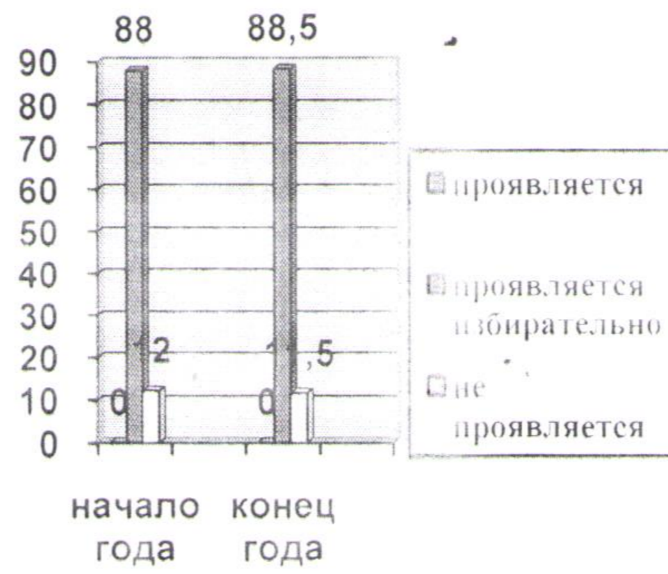
Старшая группа № 5