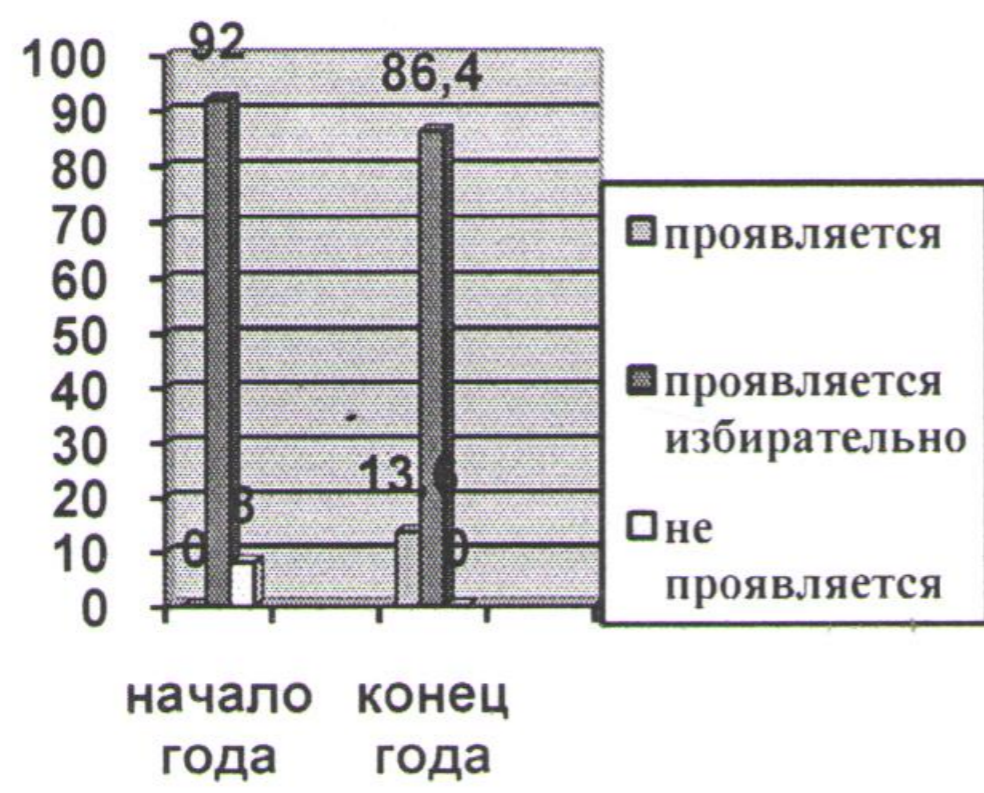
Старшая группа № 1